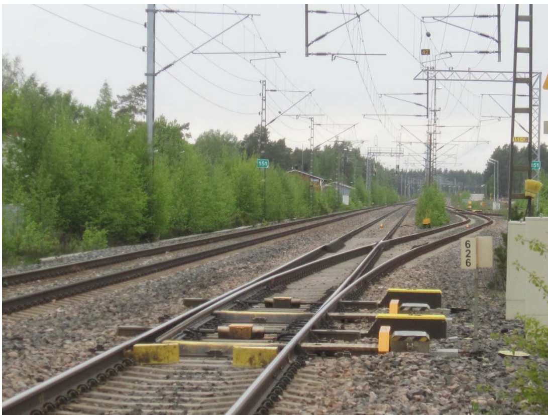
Kuva 2. Vaihde V626 kuvattuna junan tulosuunnasta.