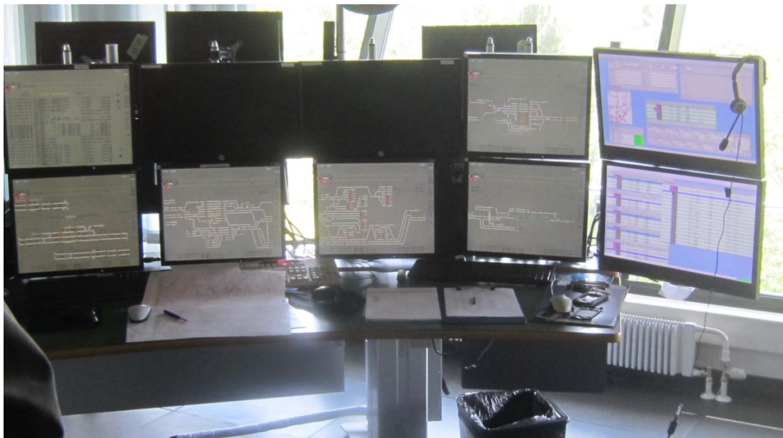
Kuva 4. Kouvola ”Ykkönen” liikenteenohjaajan työpiste, josta ohjataan Kouvolan liikennepaikan sekä litin kauko -ohjausalueetta. Uudenkylän liikennepaikka näkyy vasemmalla alhaalla olevassa näytössä.

Tapahtumapaikan liikenteenohjauksesta vastaa Finrail Oy Kouvolan ohjauspalvelut. Liikenteenohjauksessa on kolme liikenteenohjaajaa, joista ”Ykkönen” ohjaa Kouvolan liikennepaikan junaliikenteen lisäksi litin kauko -ohjausalueetta.