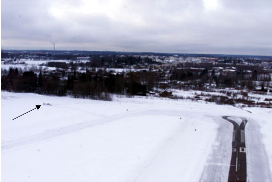
Kuva 1. Lentokoneen maahantörmäyspaikka.

tuksessa koneen laskutelineet pettivät ja kone pomppasi loivasti toiseen kosketukseen noin 15 metrin matkan. Tämän jälkeen kone pyörähti vaakatasossa noin 180° vasemmalle jääden siivilleen noin 40 m:n päähän ensimmäisestä kosketuskohdasta.