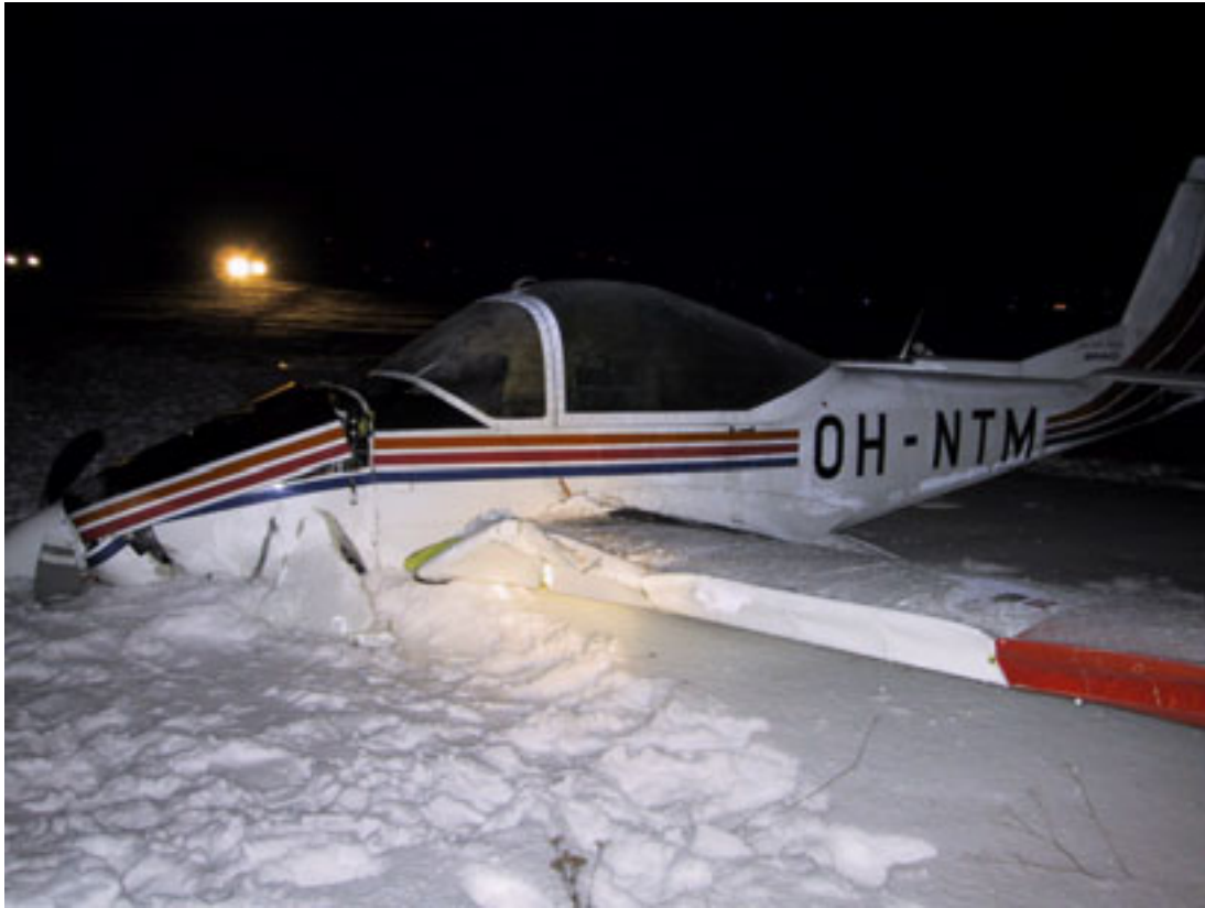
Kuva 3. Vasemman siiven etureuna oli painunut kasaan ja moottori oli taipunut alaspäin.