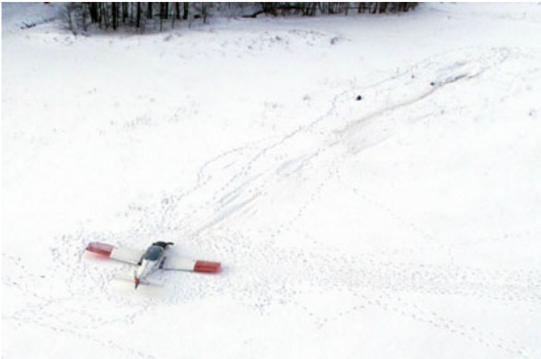
Kuva 2. Lentokoneen maahantörmäysjäljet.