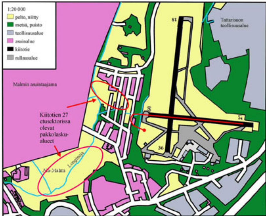
Kuva 5. Kiitotien 27 etusektorissa olevat pakkolaskualueet ja onnettomuuslennon lento-rata.