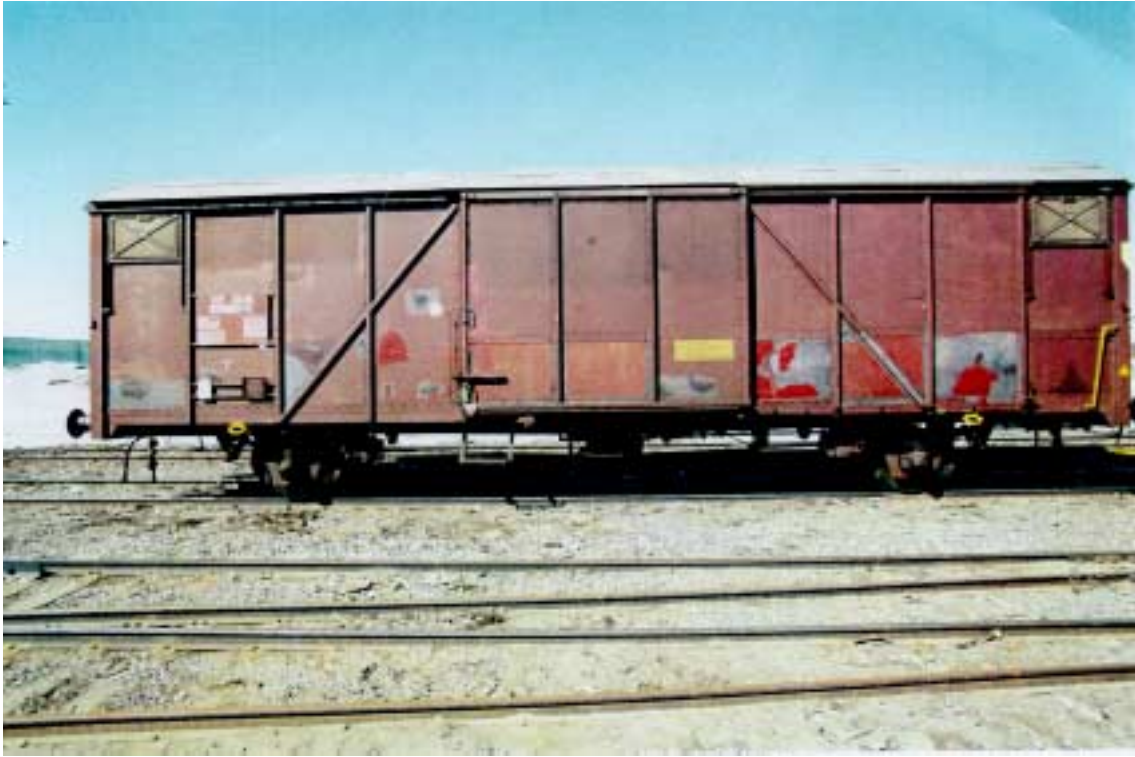
Kuva 2. Onnettomuusvaunu.