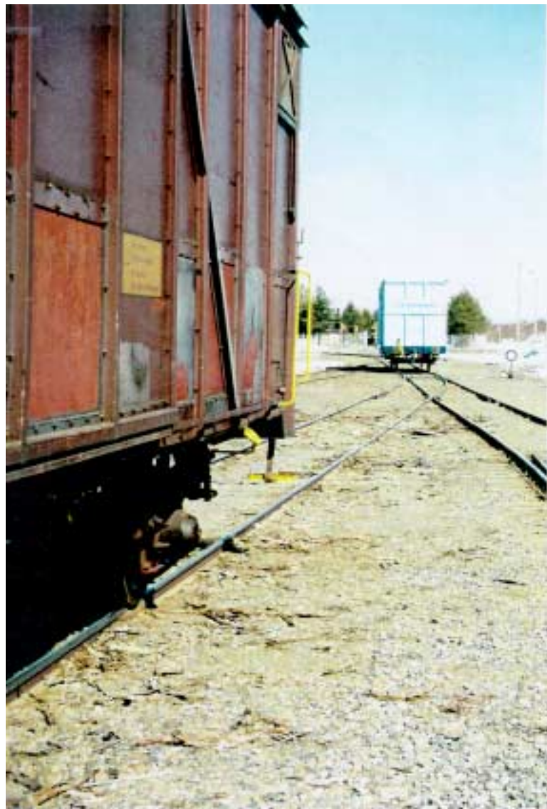
Kuva 3. Suistumiskohta vasten junan tuloa katsottuna.